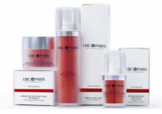
SCHISANDRA ANTI AGING