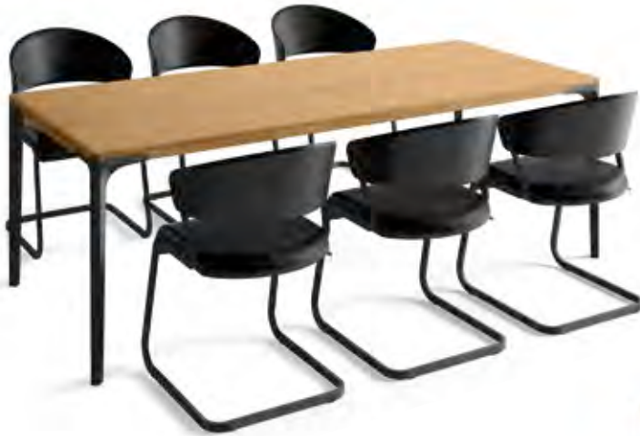
Vorzugskombination L mit Tischplatte in Eiche oder Kernussbaum