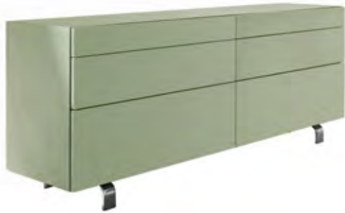
Sideboard mit Metallgestell in NCS S 4010-G50Y matt

Insgesamt in 7 Ausführungen zum Vorteilspreis – das Neo Wohnen Bestseller-Sortiment: ein Sideboard, ein Highboard und eine Vitrine.