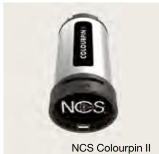
NCS Colourpin II

Wir erstatten den Kaufpreis des NCS Colourpin II, wenn der Kunde sich nach dem Kauf eines Neo Wohnen Möbels online zum Garantiepasse anmeldet und dabei die Originalrechnung bei hülsta einreicht.