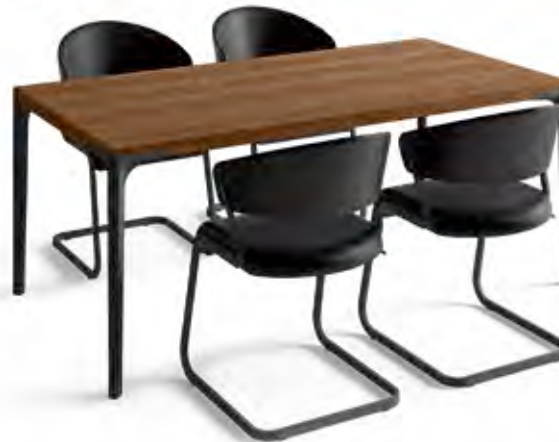
Vorzugskombination M mit Tischplatte in Eiche oder Kernussbaum