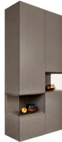
Vitrine in NCS S 6005-Y80R matt