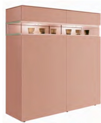
Highboard in NCS S 3020-Y80R matt